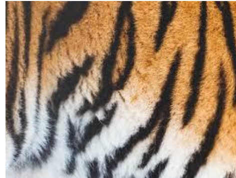
3 fourrure de tigre