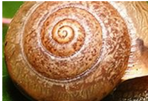
6 coquille d'escargot