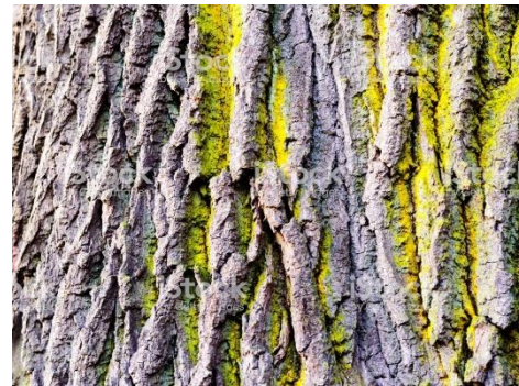
7 écorce d'arbre