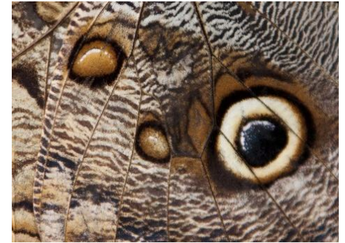
8 aile de papillon