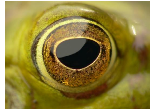
4 œil de grenouille