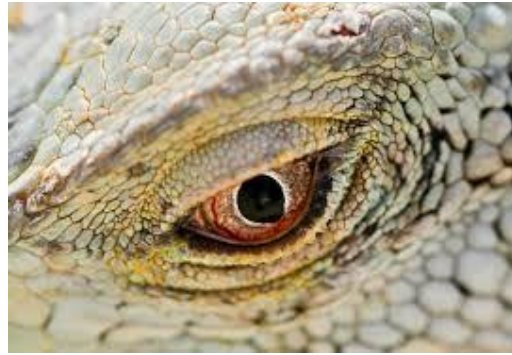
2 œil de lézard