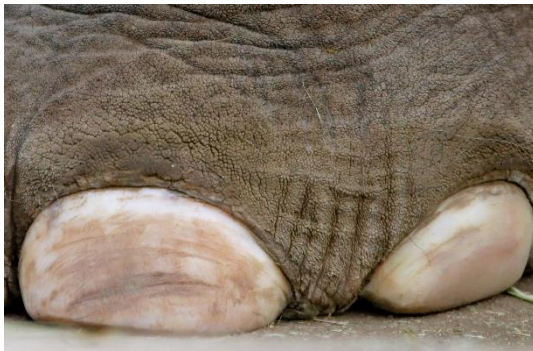
5 pied d'éléphant